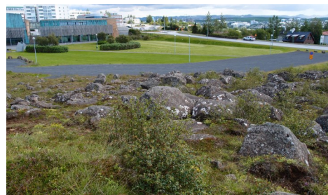
Skiptir gróðurfur grænna svæða máli?

Íbúum þéttbýlis fjölga ört og býr meirihluti mannkyns nú í borgum. Íslendingar eru þar engin undantekning; 84% landsmanna búa í þéttbýli með 2000 íbúum eða fleiri og um tveir þriðju búa á suðvesturhorninu, frá Mosfellsbæ til Hafnarfjarðar.