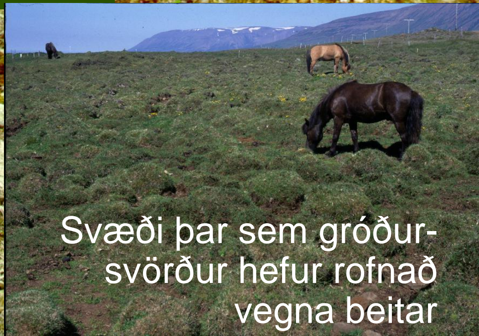
Svæði þar sem gróður-svörður hefur rofnað vegna beitar