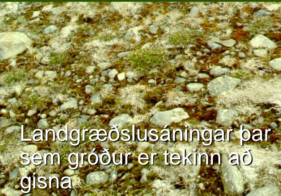
Landgræðslusáningar þar sem gróður er tekinn að gisna